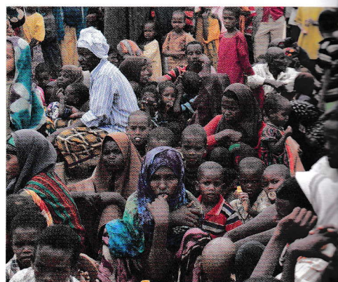
Camp de réfugiés de Dadabb au Kenya